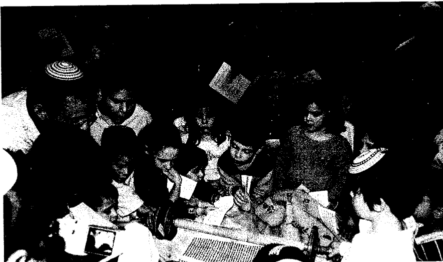
קהילת "הקהל" - מניין שוויוני בקעה